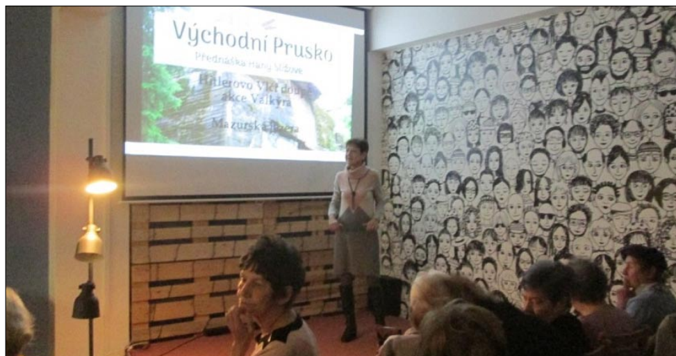
28. 1. 2020 Vorlesung Bibliothek Havířov