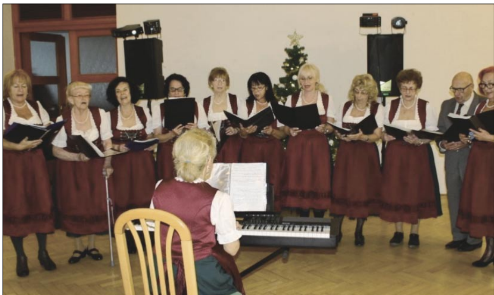
Zpěvačky 7. 12. 2019 Nikolausfeier Radnice.

Regionalverein der Deutschen des Teschner Schlesiens e.V.